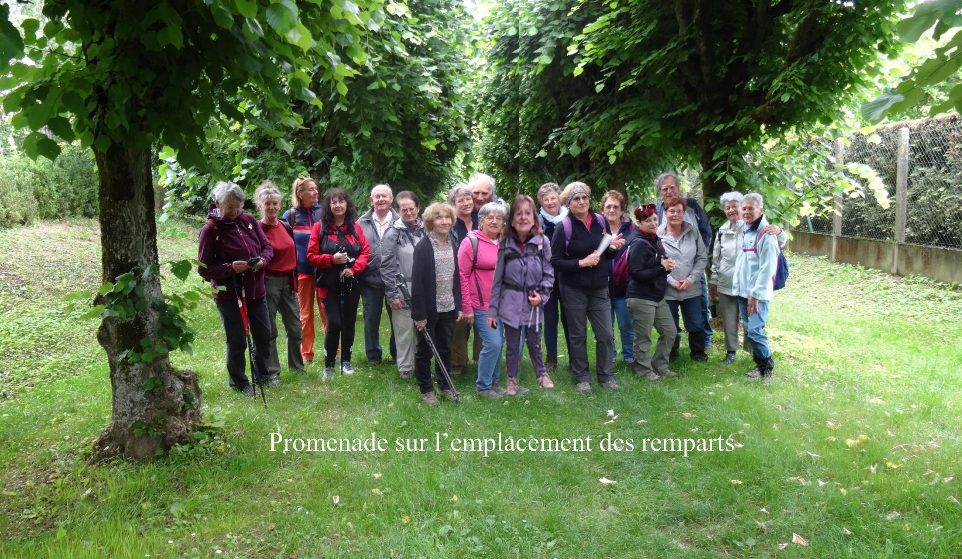
Promenade sur l'emplacement des remparts