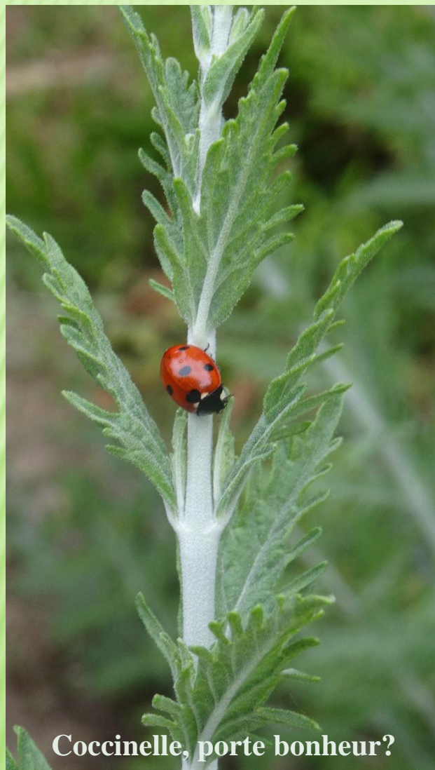
Coccinelle, porte bonheur?