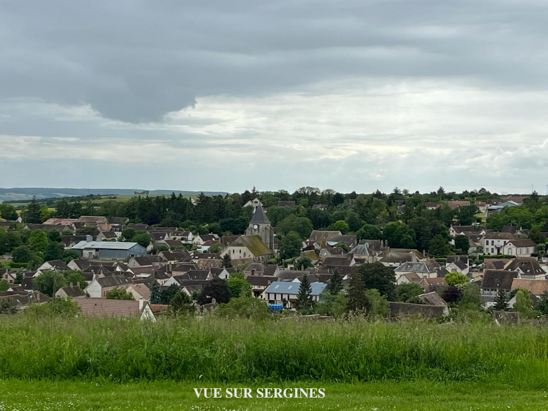
VUE SUR SERGINES